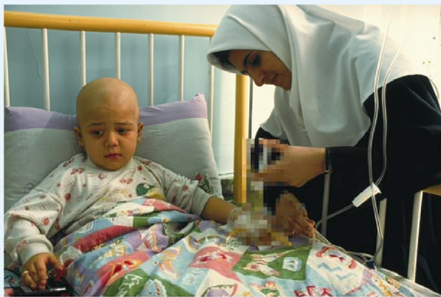
© UNICEF Iran/N. Nayvanci / 1997 / Tehran

هیچ کودکی نباید از دسترسی به مراقبت‌های بهداشتی و امکانات پیشگیری از بیماری و خدمات پزشکی محروم باشد. در صورت بیماری، شما حق دارید از بالاترین خدمات بهداشتی و درمانی برخوردار شوید. دولت هم باید به گسترش مراقبت‌ها و آموزش‌های همگانی بهداشتی، توجه فاصی داشته باشد.