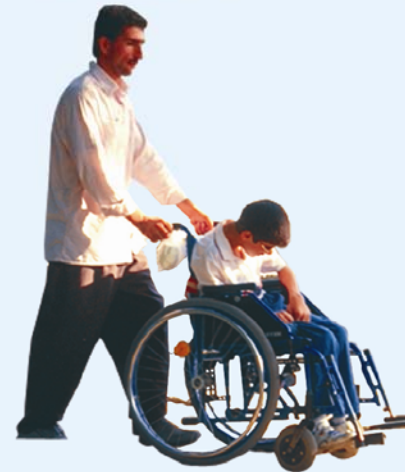
© UNICEF Iran/M. Parsamagham / 1998 / Tehran

اگر کودکی معلولیتی دارد، حق دارد از امکانات فاص بهره‌مند شده و تمت مراقبت‌های ویژه قرار گیرد. این حق کودکان معلول است که از امکانات فاص آموزشی برخوردار باشند.