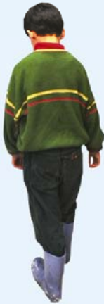
© UNICEF Iran/H. Zolfaghari / 1998 / Tehran