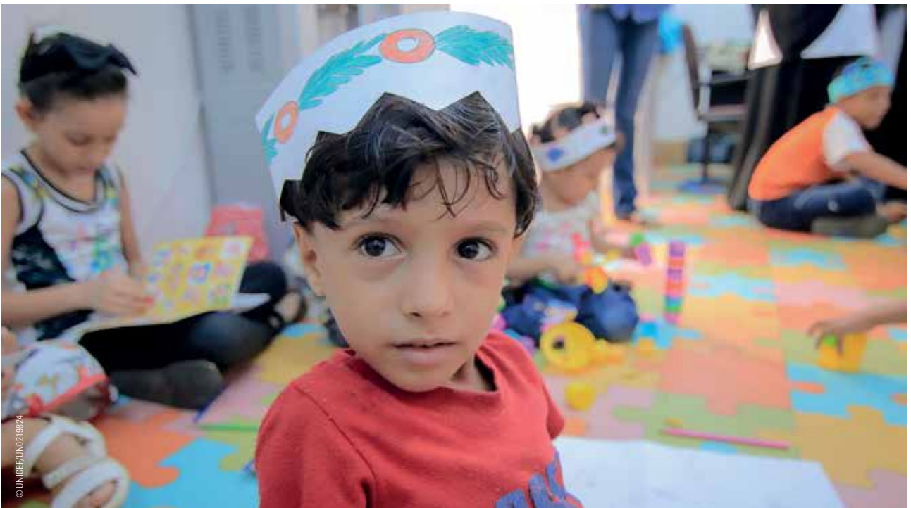
Kinder im Spielzimmer eines Gesundheitszentrums in Aden.

Alle Konfliktparteien im Jemen tragen Verantwortung für die brutale Gewalt gegen Kinder und für die katastrophale humanitäre Situation. UNICEF fordert deshalb erneut alle Konfliktparteien – sowie alle, die Einfluss auf sie haben – dazu auf, Kinder zu schützen und internationales humanitäres Recht zu achten.