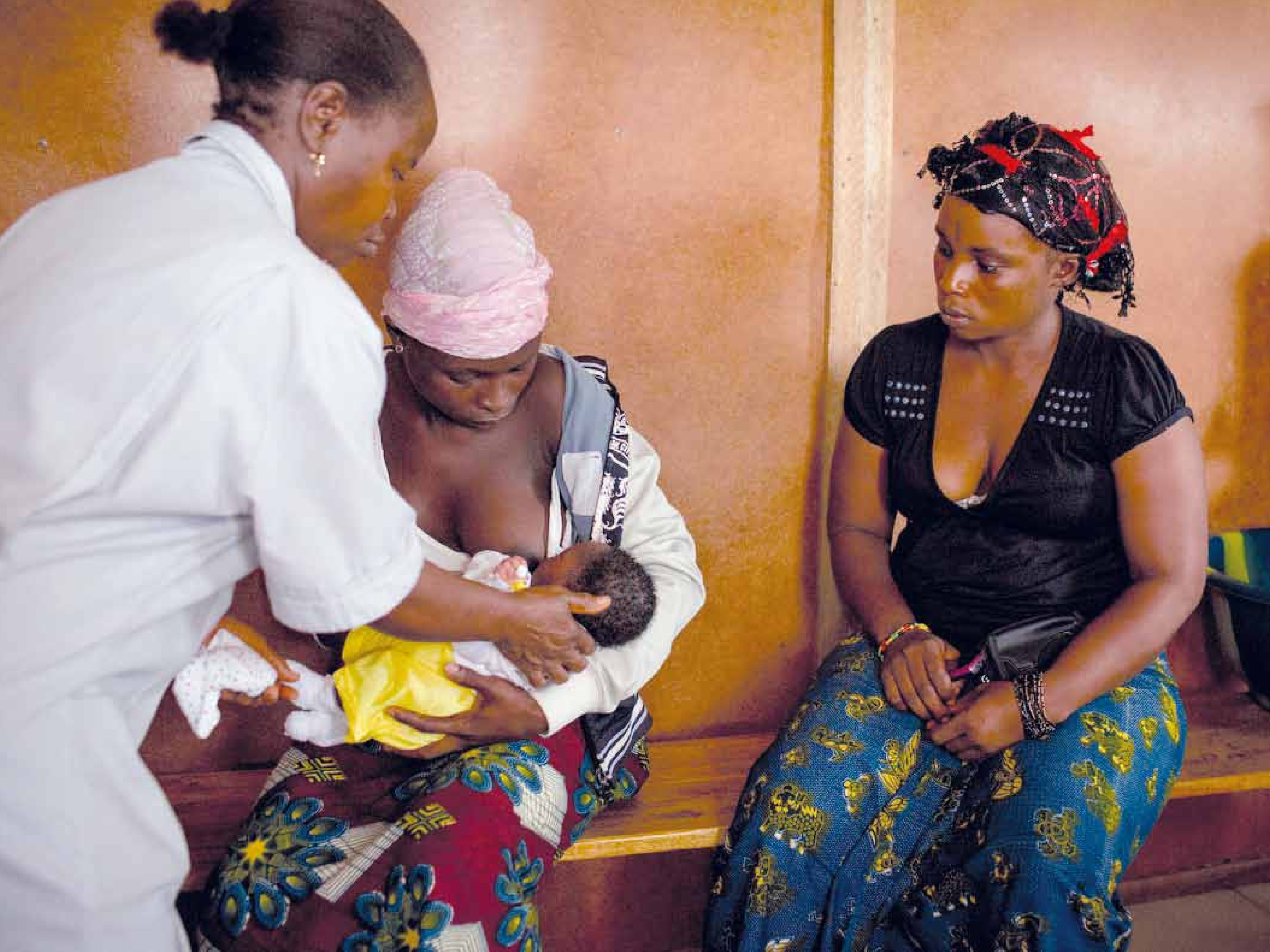
Sierra Leone: Hebammen beraten Frauen – ein wichtiger Schritt im Kampf gegen Aids