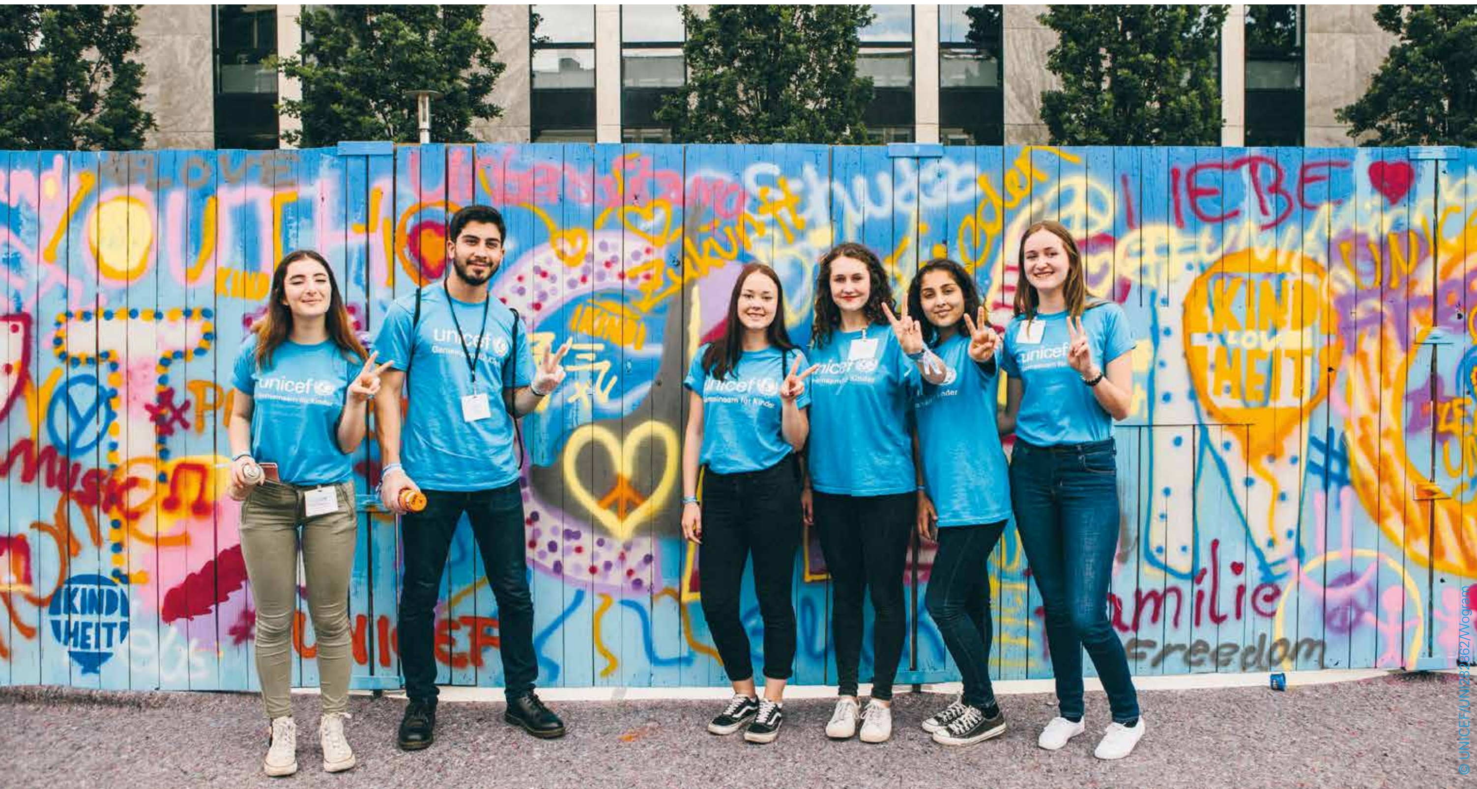
Junge Engagierte unterstützen die Aktion #sprayforPeace – beim UNICEF-Youth Festival 2016 Köln / Nürnberg