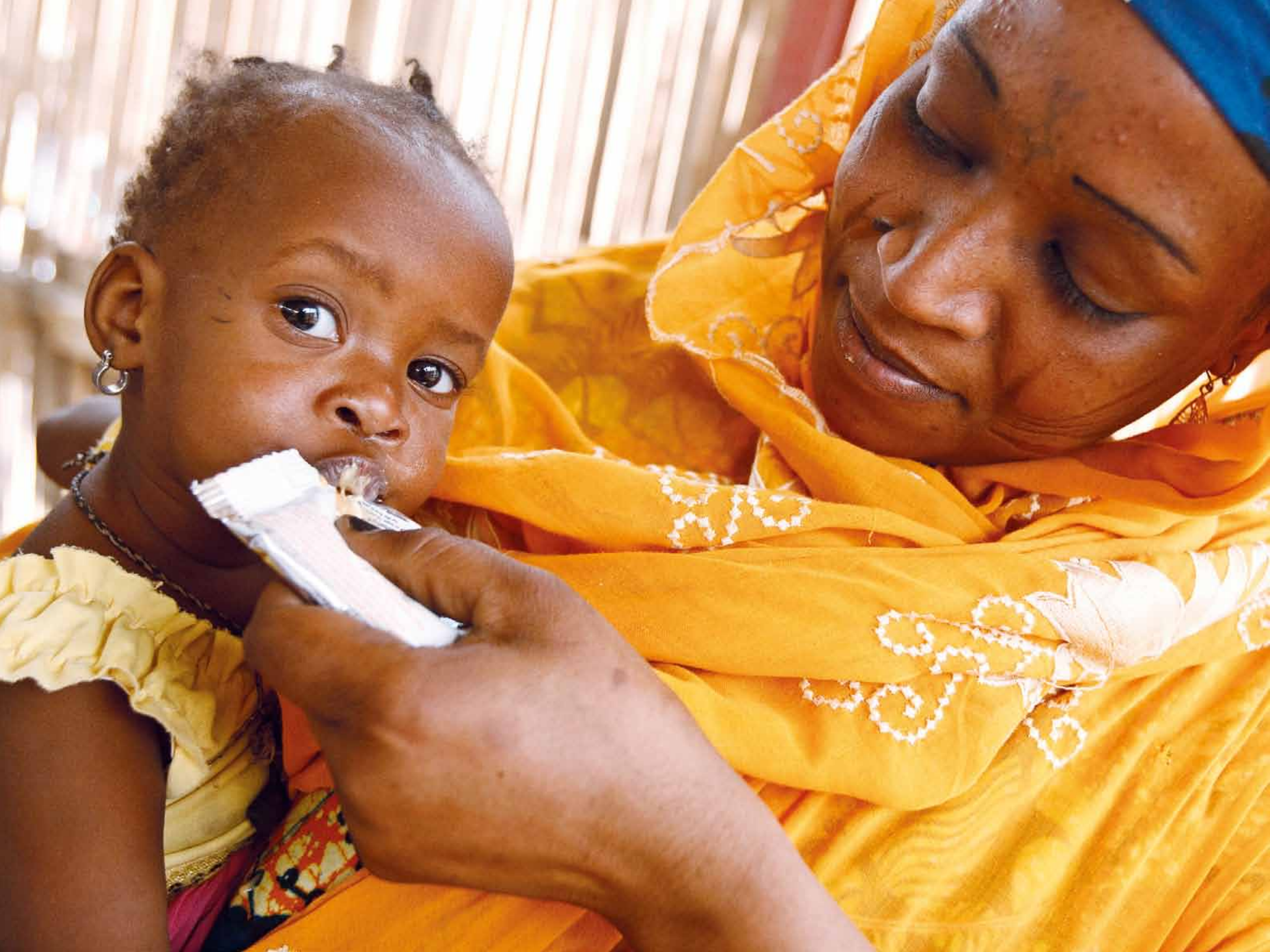
Niger: Eine Mutter füttert ihre kleine Tochter mit der Erdnusspaste