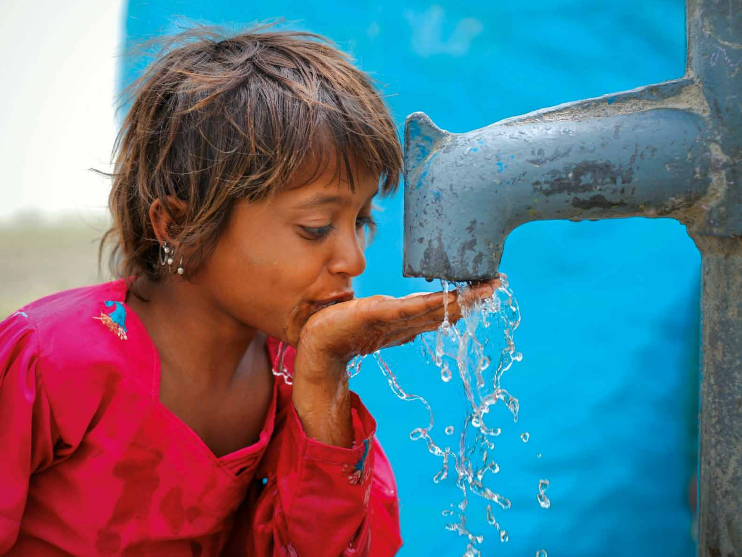
Pakistan: Ein Mädchen trinkt Wasser aus einem Brunnen, den UNICEF gebaut hat