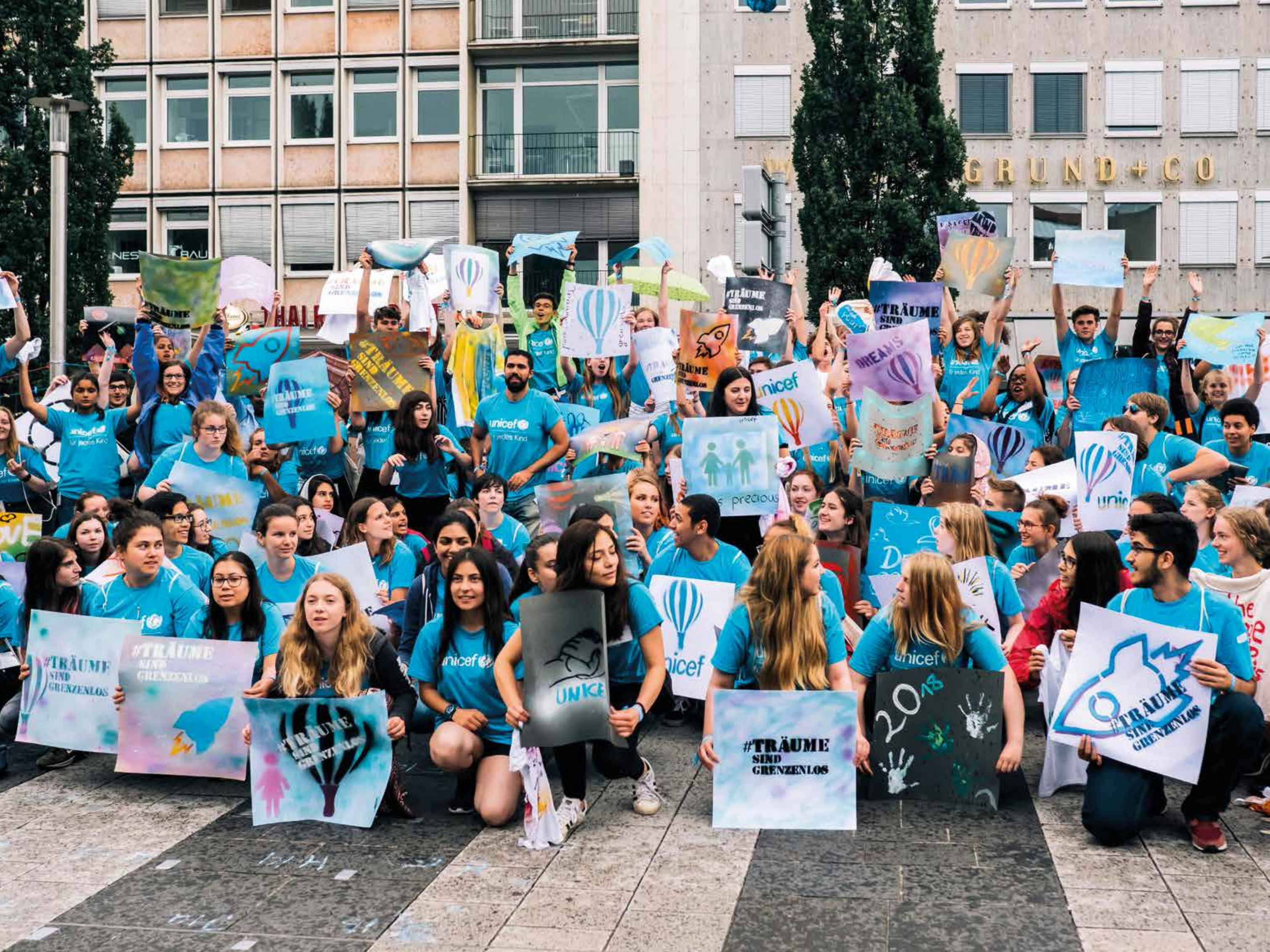
Beim UNICEF-Youth Festival treffen sich engagierte Jugendliche aus ganz Deutschland