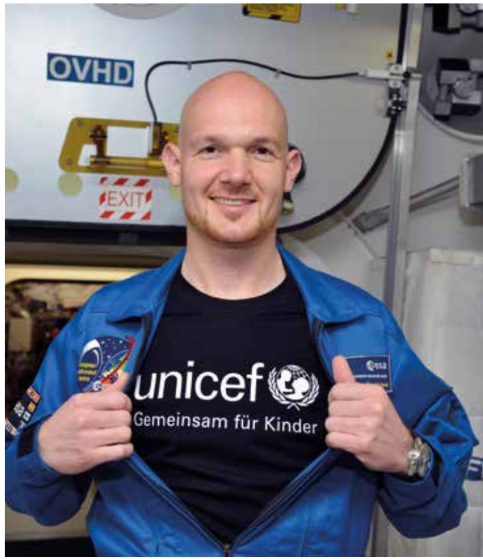
Alexander Gerst UNICEF- Botschafter