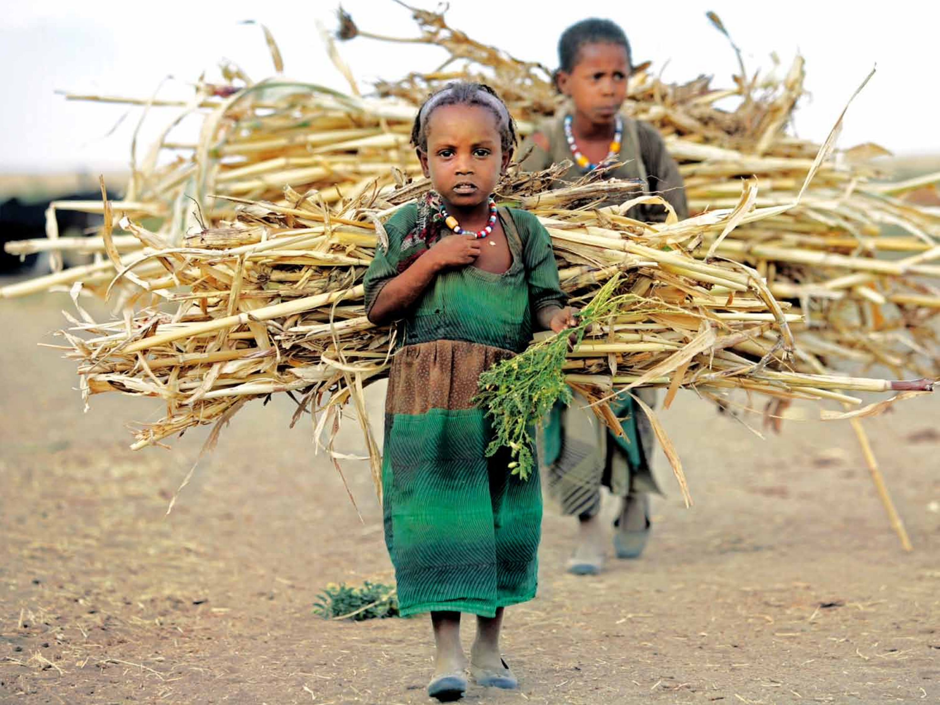
Äthiopien: Zwei Kinder tragen Brennmaterial zum Feuermachen nach Hause